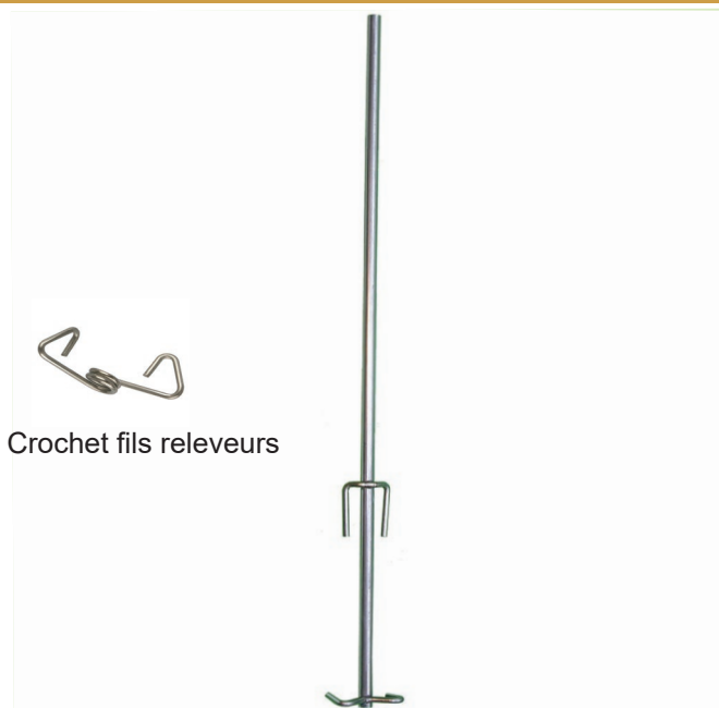
Crochet fils releveurs